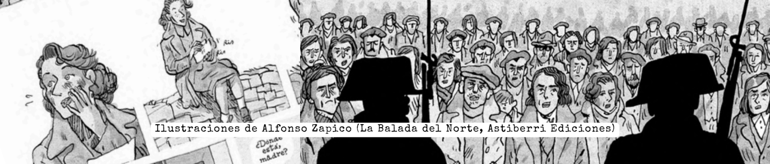
Ilustraciones de Alfonso Zapico (La Balada del Norte, Astiberri Ediciones)