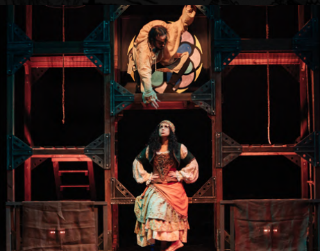
Imagen del espectáculo "La Parábola del Carbón"